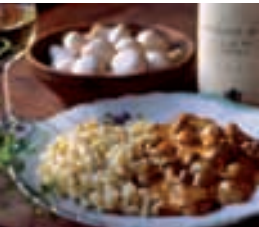
Paprikahuhn mit Nockerln