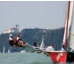
Segeln am Plattensee

Der heutige Tag kann ideal genutzt werden um die Umgebung des Plattensees zu erkunden. Besuchen Sie die Burg von Sümeg, das Schloss Fes-