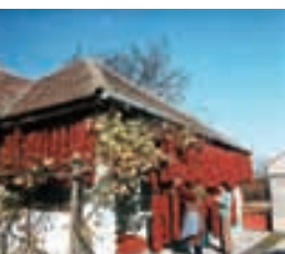
Paprikahaus in Kalocsa

Die Beschreibungen der Schlosshotels finden Sie auf Katalog S. 21.