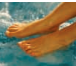
Relaxen am Wasser

Nach dem Frühstück Fahrt zum Flughafen, Abgabe des Mietwagens und Heimflug oder Verlängerung in Budapest. Auf Wunsch buchen wir Ihnen gern die Unterkunft in Budapest.