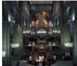
St. Peter Dom in Pécs