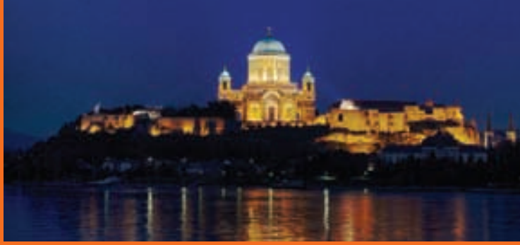
Basilika in Esztergom