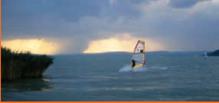
Surfen am Plattensee