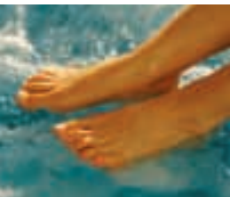
Relaxen am Wasser

Nach dem Frühstück Fahrt zum Flughafen, Abgabe des Mietwagens und Heimflug oder Verlängerung in Budapest. Auf Wunsch buchen wir Ihnen gern die Unterkunft in Budapest.