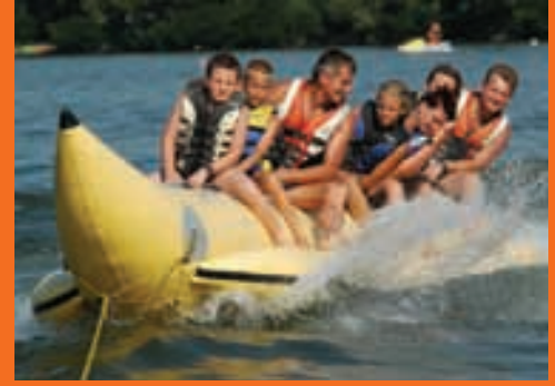
Spass für die ganze Familie