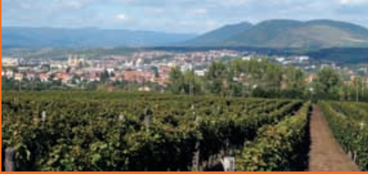
Blick über die Weinberge nach Eger