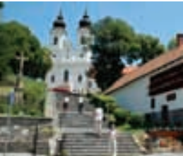
Benediktinerabtei in Tihany