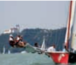
Segeln am Plattensee

Der heutige Tag kann ideal genutzt werden um die Umgebung des Plattensees zu erkunden. Besuchen Sie die Burg von Sümeg, das Schloss Fes-