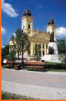
Basilika in Eger