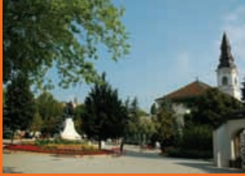
Spazierstrasse in Kecskemét