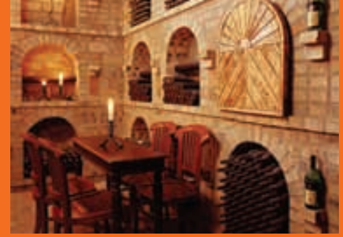
Hervorragende Tropfen in Eger