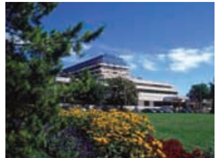
Fassade Health Spa Resort Margitsziget

Emporium Wellness und Schönheit (HSRM): verwöhnende Schönheits- und Relaxations-Behandlungen.