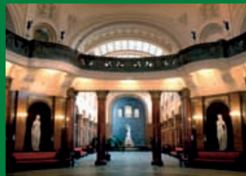
Eingangsbereich des Bad Gellért