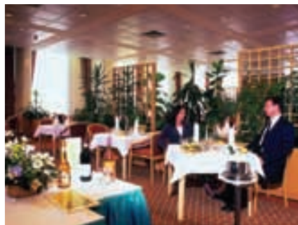
Restaurant Hotel Hélia

Gastronomie: Die Gäste des Hotels werden mit einer frischen, kreativen Küche, die sowohl ungarische als auch internationale Gerichte zubereitet, verwöhnt. Restaurant Jupiter mit Frühstück, Mittag- und Abendessen und Coffee Shop mit Snacks und Salaten für tagsüber.