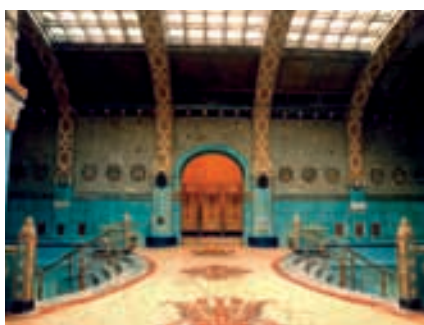
Thermalbad des Bad Gellért

Wasser: Die Wasserbecken und das Heilbad nutzen die heissen Mineralquellen des Gellért-Berges, deren Wasser radioaktiv ist und Kalzium, Magnesium, Hydrokarbonat, alkalische Stoffe, Chloride, Sulfate und Fluoride enthalten. Dieses Wasser eignet sich besonders gut bei rheumatischen Erkrankungen des Bewegungsapparates (mit Ausnahme akuter Entzündungen), subakute und chronische Gelenkentzündungen, Osteoarthritis, Unfall-Nachbehandlung,