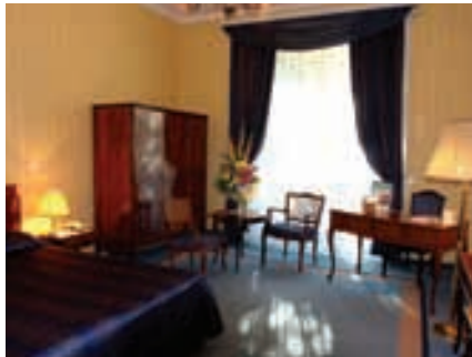
Zimmer Grand Hotel Margitsziget

Schönheitssalon Anna (GHM): Produkte von Guinot Paris, Maria Galland und QMS, Antizellulitis-Massage, Lymphdrainage, Body wrapping, Permanentes Make-up, Friseur, kosmetische Behandlungen.