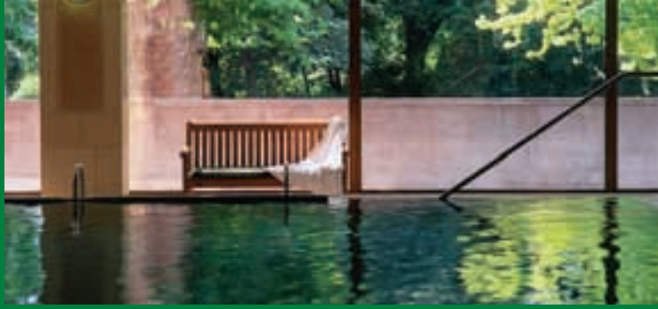
Schwimmbad im Danubius Health Spa Resort Margitsziget