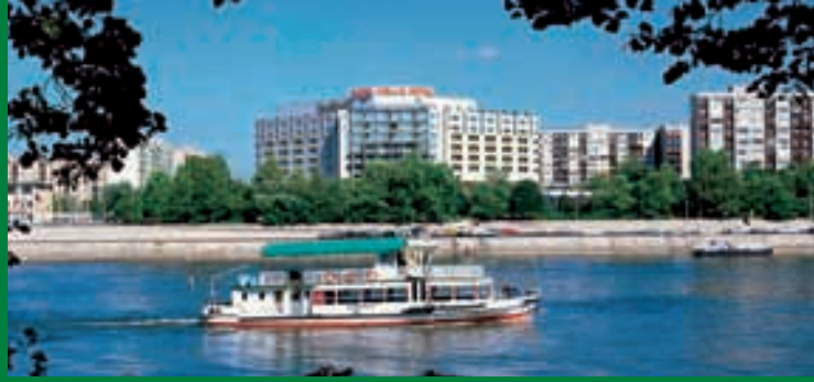
Blick auf das Danubius Health Spa Resort Hélia