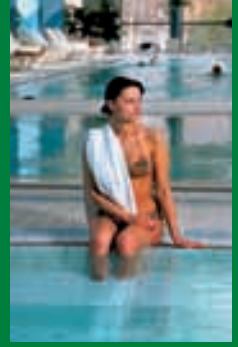
Schwimmbad Hotel Hélia

Die Hauptstadt Ungarns liegt 103 Meter über dem Meeresspiegel zu beiden Seiten der Donau. Budapest hat zahlreiche Thermalquellen mit grosser therapeutischer Wirkung. Schon die alten Römer kannten die Heilwasser von Budapest, damals Aquincum genannt und bauten dort Bäder. Während der 150 Jahre dauernden türkischen Besetzung im 16. und 17. Jahrhundert stand die Badekultur wieder ganz hoch im Kurs. Im vergangenen Jahrhundert wurde Budapest in zunehmendem Masse ein europaweit bekanntes Heilzentrum. Budapest ist die einzige Hauptstadt der Welt, die den Rang einer Bäderstadt hat.