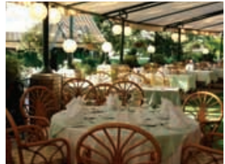
Terrasse Grand Hotel Margitsziget