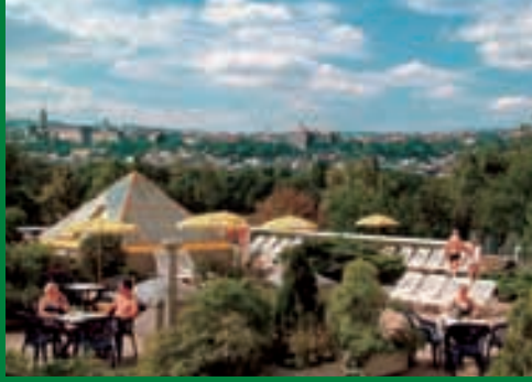
Terrasse Hotel Hélia