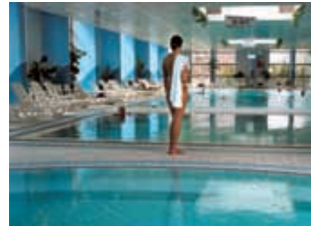
Schwimmbad Hotel Hélia

Einrichtungen: Individuelles Fitness Training, Fitness check-up, Kraft- und Cardio-Ausrüstung, Radfahren, Laufen, Übungen in Gruppen (Aerobic, Spinning, Stretching, Step, Yoga, Wassergymnastik)