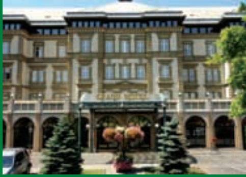
Fassade Danubius Grand Hotel Margitsziget