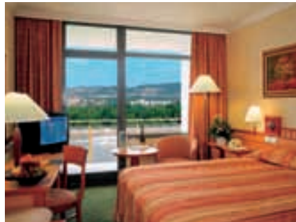
Standard Zimmer Hotel Hélia

Kapazität und räumliche Ausstattung: Alle 262 Zimmer verfügen über Bad, individuell regulierbare Klimaanlage, Safe, TV mit Satellitenprogramm, Telefon, Minibar, Blick auf die Donau, die Margareteninsel, die Budaer Hügel oder die Stadt. Einige der Zimmer haben einen Balkon. Einzel- und Doppelzimmer, Appartements mit Sauna und Business-Appartements. Nichtraucherzimmer, behindertengerechte Zimmer und Zimmer mit Verbindungstür vorhanden. Haustiere erlaubt.