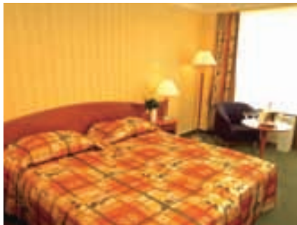
Zimmer Health Spa Resort Margitsziget