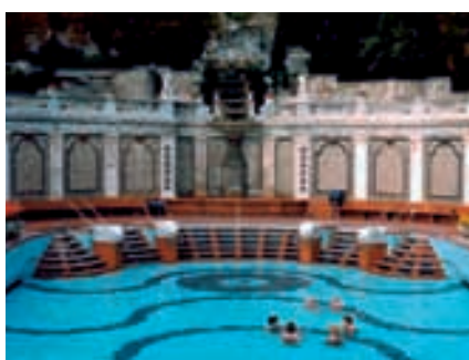
Erlebnisbad Bad Gellért

postoperative Rehabilitation von Gelenken und der Wirbelsäule, Spondylarthritis, Ankylopoetica, Spondylose, Lumbago.