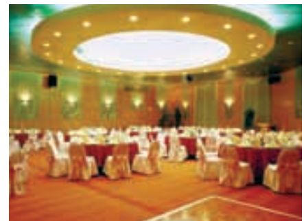
Ballsaal Hotel Hélia