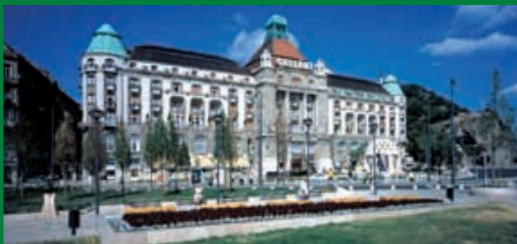
Fassade des Danubius Hotel Gellért