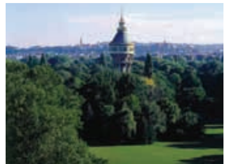
Grüne Insel Margitsziget

Wasser: Die natürlichen Thermalwasser traten erstmals im Jahre 1886 an die Oberfläche. Sie sprudeln mit einer Temperatur von 70 Grad in das Heilbad, werden aber dann auf 34 °C, 36 °C und 40 °C abgekühlt, wobei ihre einzigartigen und heilsamen Bestandteile vollständig erhalten bleiben. Das Thermalwasser auf der Margareteninsel ist bekannt für seine Heilwirkung bei Gelenk- und Muskelschmerzen, bei bestimmten degenerativen Nervenerkrankungen, einigen Blutkreislaufstörungen sowie bei vielen anderen Beschwerden.