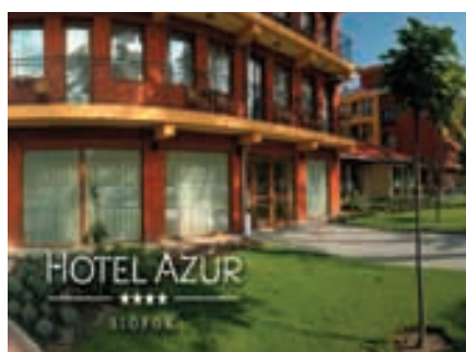
Fassade Hotel Azur