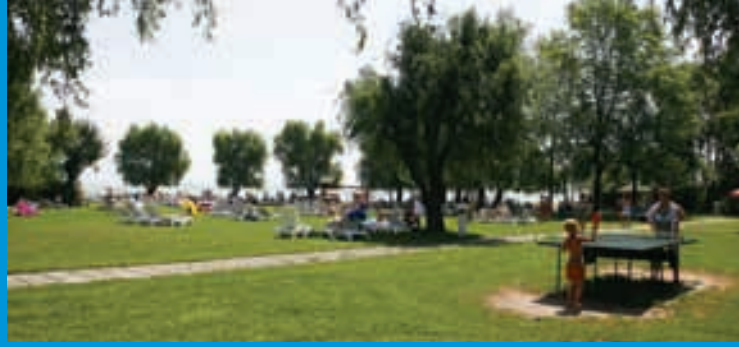
Strand des Hotel Marina