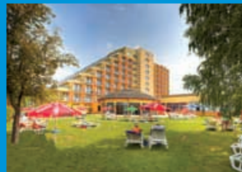
Fassade Hotel Panorama

Siófok ist der bedeutendste Badeort am Südufer des Balatons und verfügt über einen fast 20 km langen Strand und eine schier endlose Reihe von Hotels, Bars, Diskotheken und Nachtclubs, belebten Plätzen und Strassen. Es gibt einen schönen Park, eine Freilichtbühne und einige Museen. Auf das internationale Publikum wartet ein abwechslungsreiches Freizeit- und Unterhaltungsprogramm.