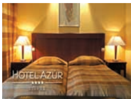
Zimmer Hotel Azur

Dienstleistungen: Konferenzzentrum, Parkplatz.