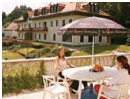
Fassade Hotel Tihany

Dienstleistungen: Souvenirgeschäft, Wäscherei und Reinigung, Schönheitssalon, Friseur, Safe, Parkplatz.