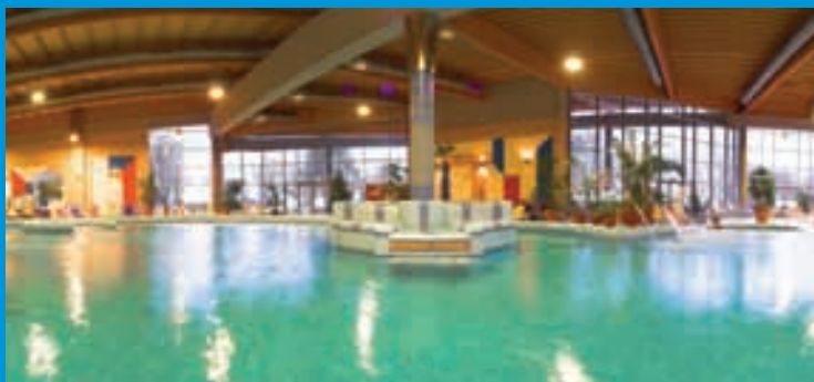
Erlebnisbad Hotel Azur