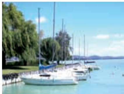
Segelhafen Hotel Panorama mit Insel