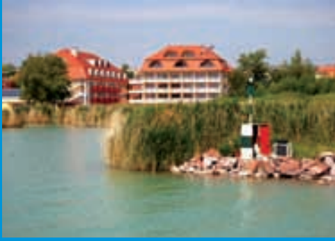
Fassade Hotel Flamingo