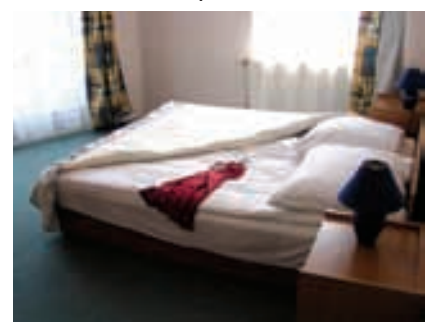
Zimmer Hotel Kristály