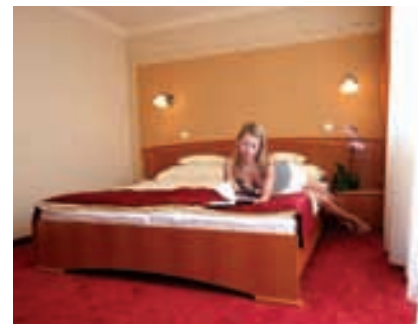
Superior Zimmer Hotel Flamingo

Dienstleistungen: Konferenzräume und -säle, Internetecke, Hotelsafe, hoteleigener Strand und Sonnengarten, Tiefgarage und geschlossener Parkplatz.