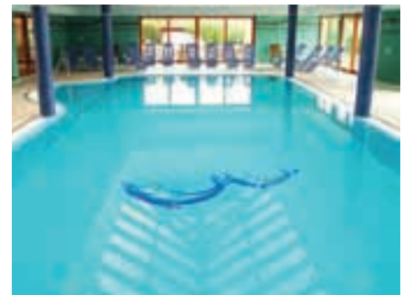
Innenschwimmbad Hotel Flamingo

Gastronomie: Restaurant mit internationalen und ungarischen und vegetarischen Speisen, Cocktail-Bar, Drinkbar, Poolbar.