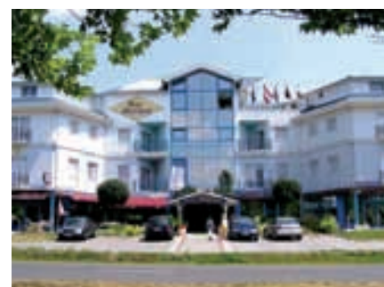
Fassade Hotel Kristály

Dienstleistungen: Konferenzräume und -säle, Hotel-safe.