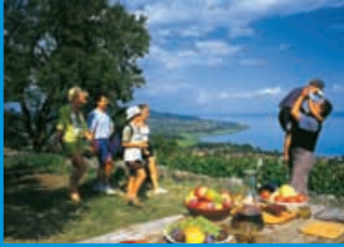
Familienausflug am Plattensee