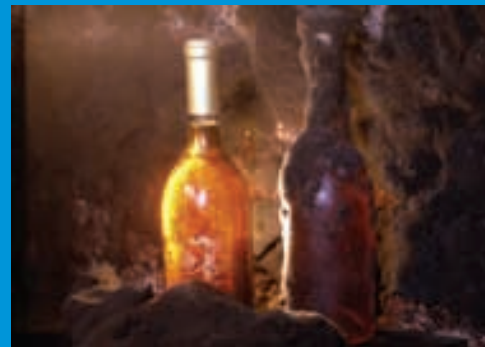
Edle Weine am Plattensee