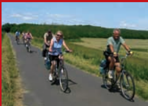
Gemütliches Velofahren durch die Tiefebene