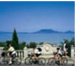
Velofahren am Plattensee

Nach dem Frühstück Fahrt zum Flughafen, Abgabe des Mietwagens und Heimflug oder Verlängerung in Budapest. Auf Wunsch buchen wir Ihnen gern die Unterkunft in Budapest.