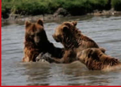
Besichtigung Bärenfarm bei der Sternen-Reittour