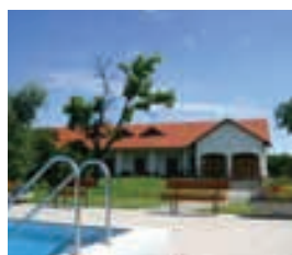
Hotel Sára, Sarlópuszta