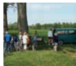
Kleine Rast mit Verpflegung