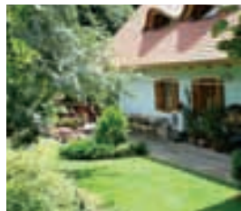
Hotel Panorama, Fót