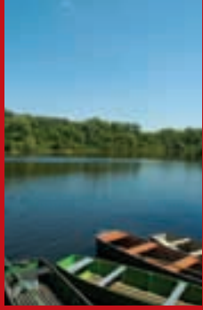
Boote am Theiss-See