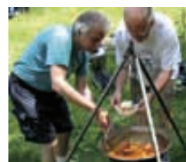
Picknick mit Kesselgulasch