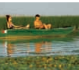
Angeln am Theiss-See

Heute haben Sie die Möglichkeit um die berühmte Puszta zu entdecken. Eine gemütliche Fahrt in Richtung Osten führt Sie zur «Brücke mit neun Löchern» und zum Hirtenmuseum, wo Sie mehr über die Lebensweise der Hirten erfahren können. Am Nachmittag Ankunft im Hotel. Hier haben Sie die Möglichkeit einen kleinen Ausritt zu unternehmen und sich nachher im Hotelschwimmbad zu erfrischen. Übernachtung in Hortobágy.