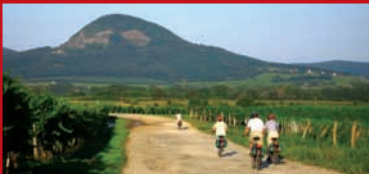
Vulkanische Hügel beim Plattensee