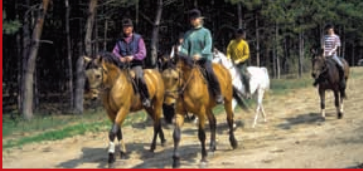
Reiten in Ungarn