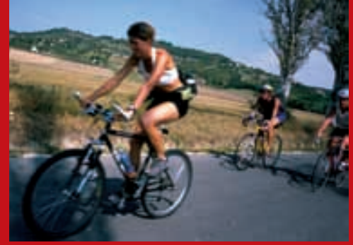
Velofahren beim Plattensee