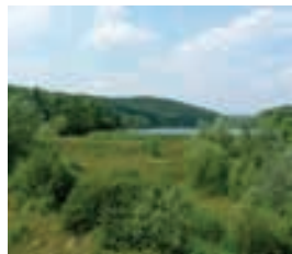
Panorama bei Fót

Abreise oder Verlängerung im Club Hotel Sarlópuszta oder einem anderen Ort. Auf Wunsch buchen wir Ihnen gerne die Unterkunft für Sie.