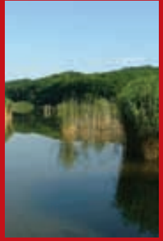
Panorama bei Fót