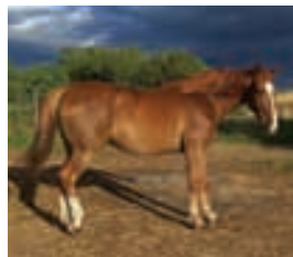
Pferd «Csábos» (Verführer)